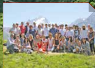
Whistler aux 2 Alpes

Bulletin d'informations de la commune Les Deux Alpes